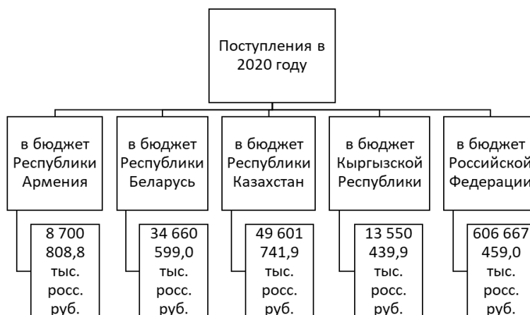
Рис. 2. Поступления ввозных таможенных пошлин в РФ за 2020 год

Нельзя рассматривать место таможенных платежей в структуре федерального бюджета исключительно в рамках Российской Федерации. Поэтому целесообразно обратиться к отчету Счетной палаты РФ о результатах совместного контрольного мероприятия.