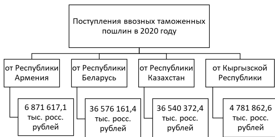
Рис. 3. Поступления ввозных таможенных пошлин в 2020 году от государств-членов

Поступления ввозных таможенных пошлин на конец 2020 года от государств-членов составили в сумме 84 770 013,5 тыс. росс. рублей, в том числе: