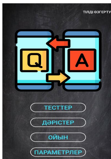
Сурет 3 – Бас мәзір

Бұл бетте пайдаланушы өз поштасы арқылы қосымшада тіркеледі. Пошта расталғаннан кейін ғана қосымшаны пайдалануға рұқсат етіледі.