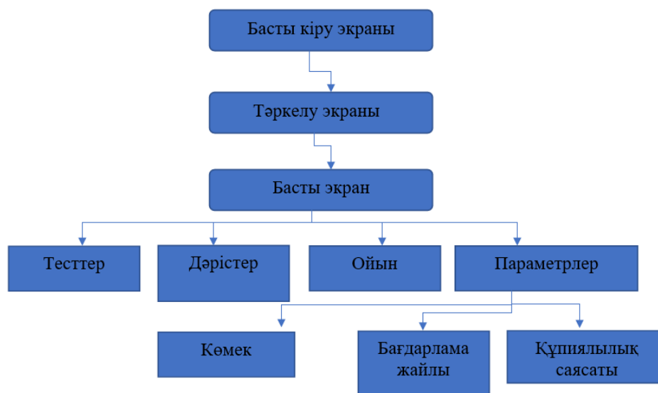
1 схема - Қосымшаның құрылымы